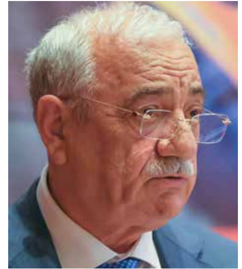
Саттар МЕХБАЛИЕВ, председатель Конфедерации профсоюзов Азербайджана