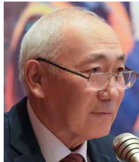
Эмиль КЫЗАЕВ, председатель Федерации профсоюзов Кыргызстана

Уважаемые делегаты и приглашенные IX съезда Всеобщей конфедерации профсоюзов!